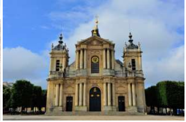
รายการทัวร์ที่น่าสนใจ ชมพระราชวังแวร์ซาย อพาร์ทเมนต์แห่งความลับ