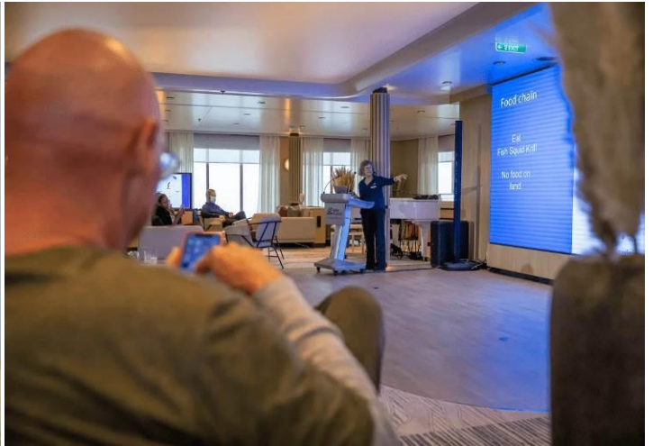
ที่พัก: SWAN HELLENIC DIANA