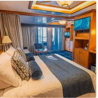
The Palace An exclusive ship-within-a ship boutique hotel enclaved with private facilities and a 24-hour butler service for connoisseurs of true luxury.