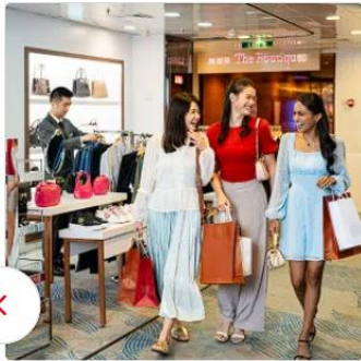
Dream Boutiques Splurge on international luxury brands at our boutiques and take your pick from some of the biggest names in fashion!

..... อิสระเดินทางเอง (ไม่รวมตัวเครื่องบินไป-กลับ) 16.00 น. เช็ก-อิน ณ ท่าเรือ Singapore Cruise Centre (Harbourfront cruise center) วันแรก ควรถึงท่าเรือก่อนเวลาเช็กอิน ไม่น้อยกว่า 3 ชม. ก่อนเวลาเรือออกจากท่าเรือ *** LAST BOARDING / GATE CLOSE TIME IS 19:00 น. *** จากนั้นนำทุกท่านเช็กอินขึ้นเรือสำราญ STAR VOYAGER CRUISE เป็นเรือสำราญลำใหม่ล่าสุดจากสายการเดินเรือ Star Dream Cruises ซึ่งจะเริ่มให้บริการตั้งแต่วันที่ 26 มีนาคม 2025 เป็นต้นไป โดยมีท่าเรือหลักอยู่ที่สิงคโปร์ และจะมีการเดินทางไปยังจุดหมายปลายทางยอดนิยมในเอเชียตะวันออกเฉียงใต้ เช่น จาการ์ตา เมดาน มะละกา ปูเลาเรดัง กรุงเทพฯ เกาะสมุย และโฮจิมินห์ซิตี้ 20.00 น. เรือสำราญ STAR VOYAGER ออกจากท่าเรือ Singapore Cruise Centre (Harbourfront cruise center) จากนั้นอิสระพักผ่อนบนเรือตามอัธยาศัย ***Casino จะเริ่มให้บริการหลังเรือล่องออกไปกลางทะเล *** คาสิโน บนเรือสำราญ ให้บริการหลังจากเรือออกเดินทาง และจะหยุดให้บริการเมื่อเรือจอด **ไฮไลต์บนเรือ** อาหาร & ร้านอาหาร: รวมอาหารหลากหลายจาก The Lido, Sophia, North Star ความบันเทิง: โรงละคร Zodiac Theatre, Velvet Lounge, The Playbook และกิจกรรมสนุกๆ บนเรือ โซนสำหรับครอบครัว: Kids Water Park, Rock Wall และกิจกรรมสำหรับเด็ก สุขภาพ & ผ่อนคลาย: Symphony Spa & Wellness, Symphony Fitness, Symphony Salon กีฬา & กิจกรรม: Adventure Park (Rock Wall, Walk the Plank, Zipline), Lawn Bowls, Shuffleboard**