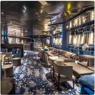
Velvet Lounge Indulge in signature cocktails, premium wines, and spirits in a cozy, stylish setting. Enjoy live entertainment and stunning ocean views as you unwind onboard.