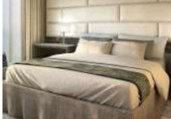
CLASSIC VERANDA SUITE

*กรุณาตรวจสอบเงื่อนไขการจองทุกครั้งก่อนทำการจอง*