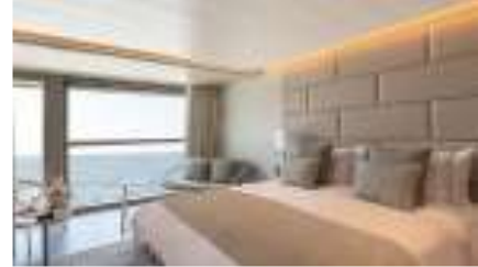
SUPERIOR VERANDA SUITE