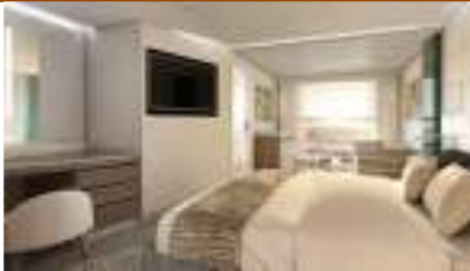
DELUXE VERANDA SUITE