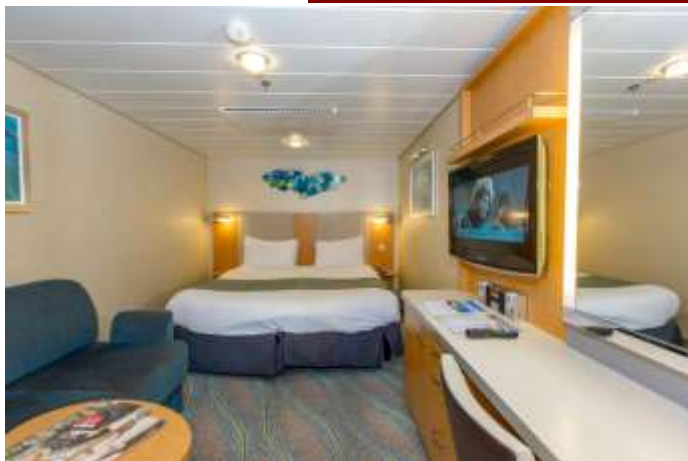
ห้องไม่มีหน้าต่าง Interior Stateroom