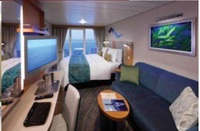
ห้องมีระเบียง Balcony Stateroom

สนใจห้องพักบนเรือประเภทอื่นๆ นอกเหนือจากที่ระบุ โปรดสอบถามค่าบริการเพิ่มเติมจากเจ้าหน้าที่