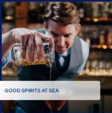
GOOD SPIRITS AT SEA