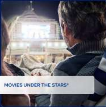
MOVIES UNDER THE STARS®