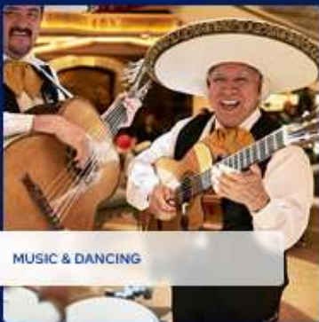
MUSIC & DANCING