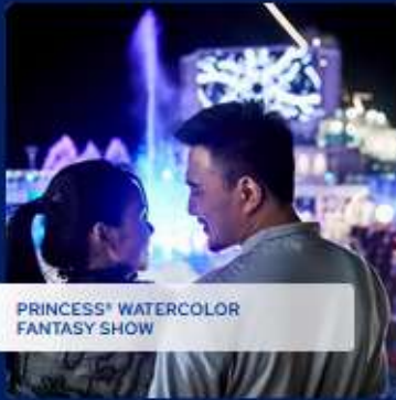
PRINCESS® WATERCOLOR FANTASY SHOW