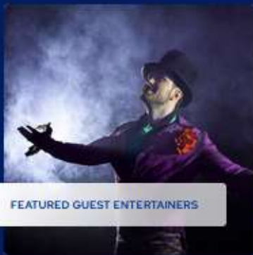
FEATURED GUEST ENTERTAINERS