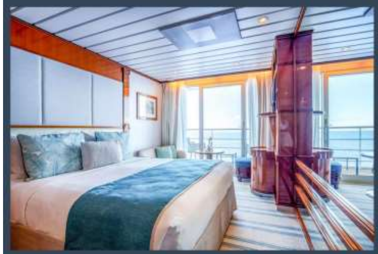
BALCONY STATEROOM C – DECK 7

In addition to the common services provided to all our suites and staterooms: