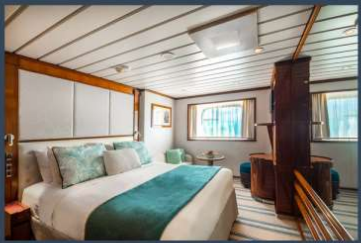
WINDOW STATEROOM E – DECK 4

In addition to the common services provided to all our suites and staterooms: