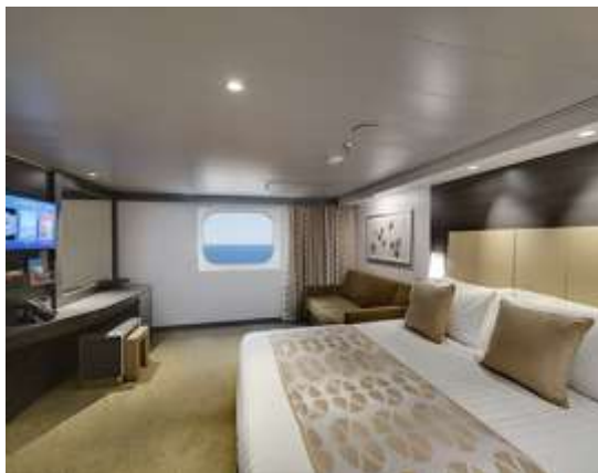
Deluxe Interior ไม่มีหน้าต่าง