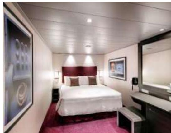
Deluxe Oceanview มีหน้าต่าง