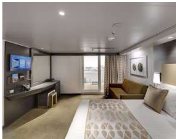
Deluxe Balcony มีระเบียง