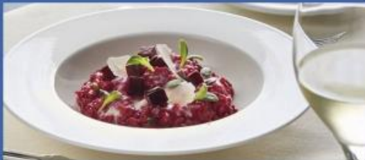
Deck 6 Lighthouse Restaurant