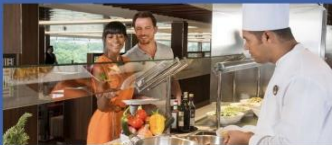
Deck 15 Marketplace Buffet