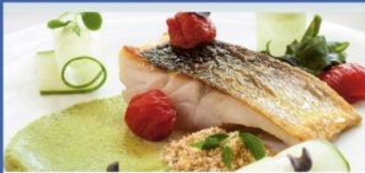
Deck 6 il Ciliegio

ห้องอาหารหลัก บริการอาหารมือค้ำ แบ่งเป็น 2 รอบ อาหารจะเป็นเมดิเตอร์เรเนียน และอาหารนานาชาติ **น้ำดื่มจะมีบริการในห้องบุฟเฟต์เท่านั้น**