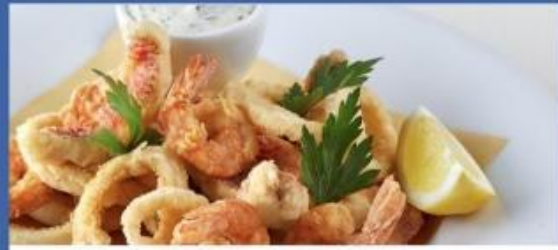
Deck 6 Le Cerisier