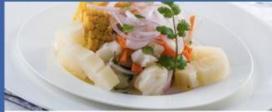
Deck 5 Posidonia Restaurant