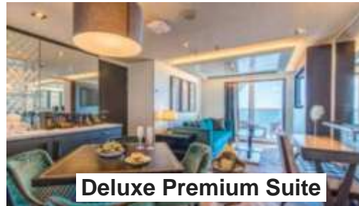
Deluxe Premium Suite