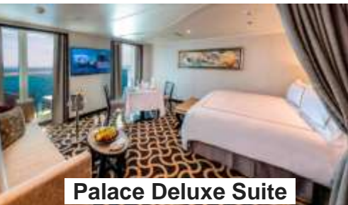
Palace Deluxe Suite