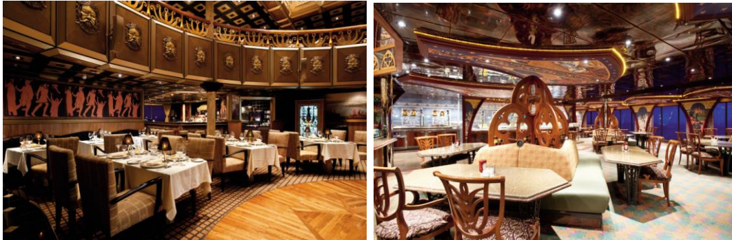
อิสระกับการพักผ่อนบนเรือสำราญ กับกิจกรรมนันทนาการชนิดที่ทำให้ทุกท่านสุขสำราญ

เช้า/เที่ยง ท่านสามารถรับประทานอาหารอย่างอิสระได้ตามห้องอาหารที่เรือเตรียมไว้ให้