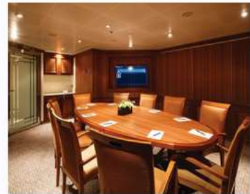
Card Room/conference Room

Enjoy a selection of games at the Silversea Casino for guests 18 and older, or discover new games during your luxury cruise.