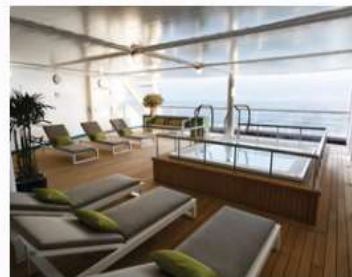
Zagara Beauty Spa

Relax and unwind in the Panorama Lounge, a sophisticated yet amicable space offering beautiful ocean views as you enjoy your cruise.