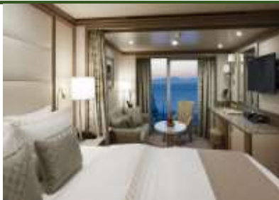
Classic Veranda Suite