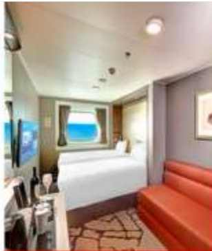
Oceanview Stateroom with Window 84 Staterooms from 16 sq.m – 35 sq.m