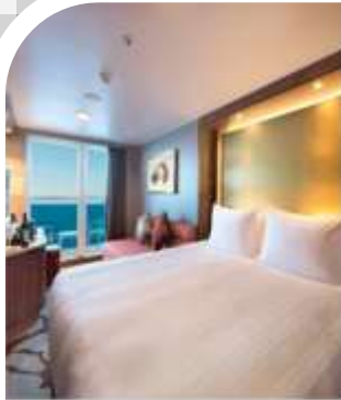
Oceanview Stateroom with Balcony 1,046 Staterooms from 20 sq.m – 28 sq.m