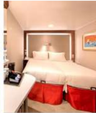
Interior Stateroom 402 Staterooms from 13 sq.m – 14 sq.m