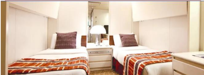
Interior cabin Category L (Decks 5, 6, 9)