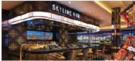
The Skyline Bar

Found inside our award-winning casino, this is the perfect spot to have a cocktail before dinner, meet friends after the show or just press your luck with bar-top poker screens. Seating capacity: 18