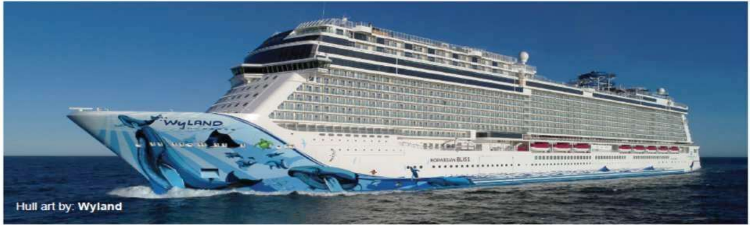
Hull art by: Wyland

Built: 2018 • Gross Tonnage: 168,028 • Guests (Double Occupancy): 4,004 • Overall Length: 1,094ft • Max Beam: 136ft • Crew: 1,716