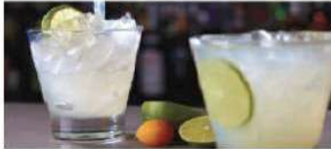
The A-List Bar

The perfect spot to sip a handcrafted cocktail and enjoy the performances from inside The Manhattan Room. Seating capacity: 20