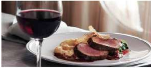
The Manhattan Room

One of three Main Dining Rooms, The Manhattan Room is where guests can enjoy specially curated modern and classic dishes made with the freshest ingredients. Seating capacity: 560