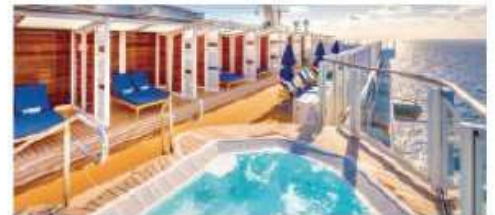
Vibe Beach Club

Vibe Beach Club An adults-only private retreat with stunning views, oversized hot tub and full-service bar. Seating capacity: 60