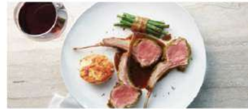
The Haven Restaurant

Savor an exclusive array of dishes for breakfast, lunch and dinner in a private restaurant serving the finest cuisine. Enjoy stunning vistas indoors or al fresco. Exclusively for guests of The Haven. Seating capacity: 98