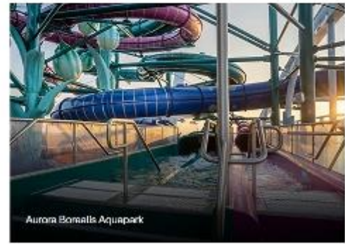
Aurora Borealis Aquapark