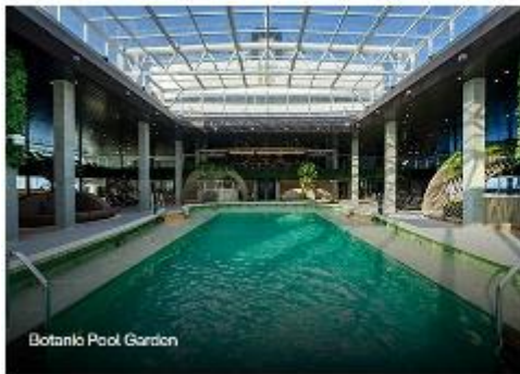
Botanik Pool Garden