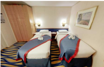
ห้องพักไม่มีหน้าต่าง