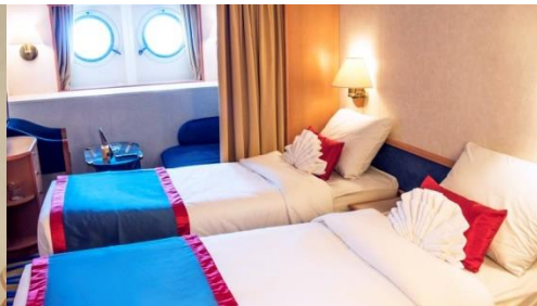
ห้องพักมีหน้าต่าง