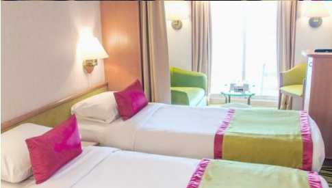
ห้องพักไม่มีหน้าต่าง