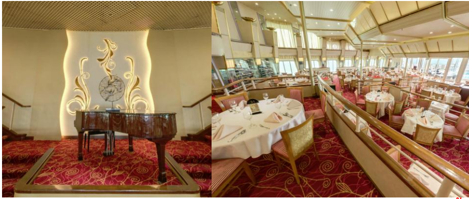
หลังอาหารเชิญท่านชมการแสดงสุดอลังการ ณ ห้อง Stardust Lounge บริเวณชั้น 10