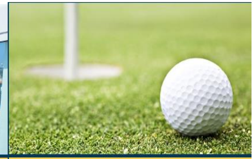
Golf Driving Range