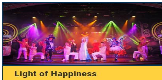
Light of Happiness

หลังอาหารเชิญท่านชมการแสดงสุดอลังการ ณ ห้อง Stardust Lounge บริเวณชั้น 10