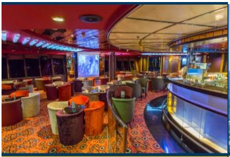
Karaoke Lounge / KTV