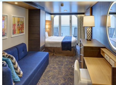
Ocean View Balcony ห้องพักมีระเบียง 198 sq. ft. + 55 sq. ft.