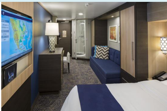
INTERIOR ห้องพักไม่มีหน้าต่าง 166 sq. ft.