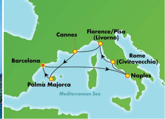
Norwegian Epic: Epic Class

DESTINATIONS Western Mediterranean from Barcelona