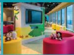
Little Pandas Club Kids club with supervised activities