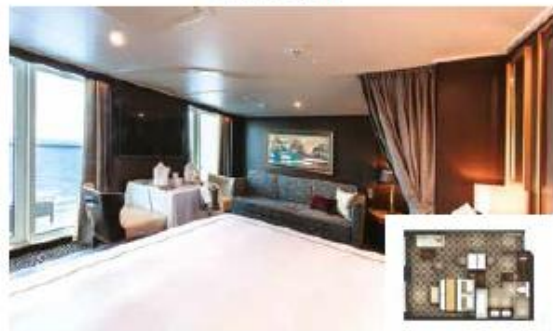
From 37 sq.m Max Occupancy 4 | Deck 13/15/16/17 1 Queen-size Bed + 1 Double Sofa Bed