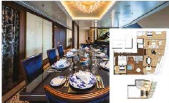
Approx. 224 sq.m | Max Occupancy 6 | Deck 17 1 King-size Bed + 1 Queen-size Bed + 1 Double Sofa Bed