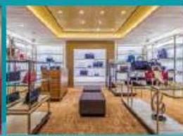
The Dream Boutiques Spurge on duty-free shopping