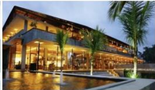
Secret Garden Village

16.00 น. เรือออกจากท่าเรือ บาทลีเหนือ ประเทศอินโดนีเซีย เย็น รับประทานอาหารเย็นที่ทางเรือได้ไว้ให้