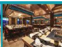
Umi Uma Teppanyaki Grand tables for grilling action