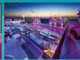
Zouk Beach Club Outdoor party/entertainment venue