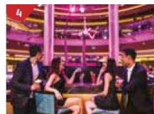
Bar 360 Catch live music and aerial acrobatic performances with a glass of champagne.