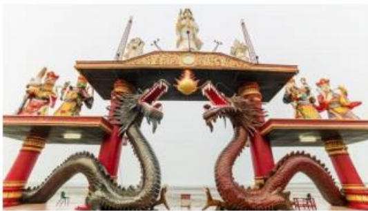
Klenteng Sanggar Agung

08.00 น. เรือจอดที่ท่าเรือสุราบาย่า ประเทศอินโดนีเซียสำหรับท่านที่ทำการจองทัวร์บนฝั่งกับทางเรือ พนักงานจะแจ้งเวลาออกจากเรือและสถานที่นัดพบบนเรือ ส่วนท่านที่สะดวกเดินทางท่องเที่ยวเอง สามารถลงจากเรือหลังเวลาเรือจอด 1 ชั่วโมง ณ บริเวณท่าเรือ กรุณากลับถึงเรือก่อนออก 1 ชม