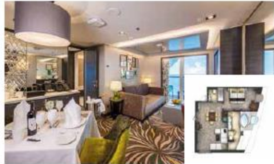
Approx. 37/56 sq.m | Max Occupancy 4-6* | Deck 13/16 1 King-size Bed + 1 Double Sofa Bed