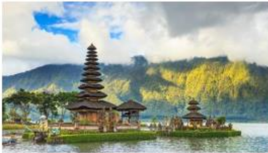
Temple Ulun Danu at Lake Bratan

06.00 น. เรือจอดเทียบท่าที่ บาทลีเหนือ ประเทศอินโดนีเซีย สำหรับท่านที่ทำการจองทัวร์บนฝั่งกับทางเรือ พนักงานจะแจ้งเวลาออกจากเรือและสถานที่นัดพบบนเรือ ส่วนท่านที่สะดวกเดินทางท่องเที่ยวเองสามารถลงจากเรือหลังเวลาเรือจอด 1 ชั่วโมง ณ บริเวณท่าเรือ หากท่านได้ทำการเที่ยวเองกรุณากลับถึงเรือก่อนออก 1 ชม