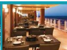
Hot Pot Outdoor hot pot with scenic ocean views