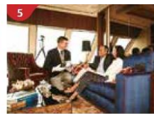
The Palace Indulge in European-style butler service and exclusive facilities.