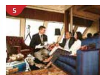
The Palace Indulge in European-style butler service and exclusive facilities.