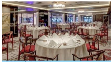
Genting Dining Room ชั้น 8 (ท้ายเรือ) บริการอาหารจีน