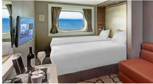
ห้องพักแบบมีหน้าต่าง Ocean View