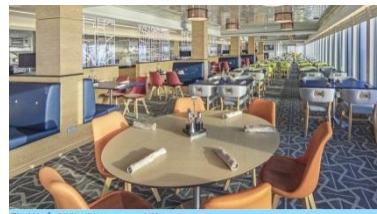
The Lido ชั้น 16 (ท้ายเรือ) บริการอาหารบุฟเฟต์นานาชาติ