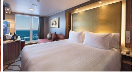
ห้องพักแบบมีระเบียง Balcony

อัตราค่าบริการ ต่อท่าน แบบพัก 2 ท่านต่อห้อง วันที่ 27 ม.ค.-1ก.พ. // 10-15 มี.ค. 62