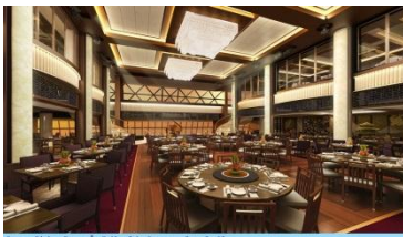
Dream Dining Room ชั้น 7 (ท้ายเรือ) บริการอาหารจีนและมังสวิรัต

อิมพอร์ตอาหารหลากหลายเมนูใน 4 ห้องอาหารที่ท่านสามารถเลือกเองได้