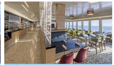
World Grill ชั้น 16 (ท้ายเรือ)

พบกับกิจกรรมสุดมันส์และสัมผัสความสนุกแบบไม่รู้จบ