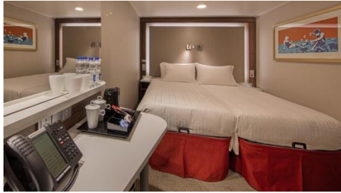
ห้องพักแบบไม่มีหน้าต่าง Inside

**กรุณาตรวจสอบภาระของท่านก่อนออกจากท่าเรือ**