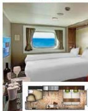
From 16 sq.m Max Occupancy 2-4 Deck 5/9/10/11/12/13 2 Single Beds - 2 Single Sofa Beds/ 1 Single Sofa Bed