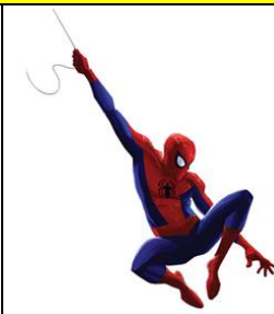
Web Swing like a Spider-Hero