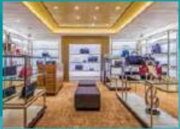
The Dream Boutiques Spit up on duty-free shopping