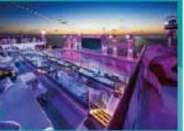
Zouk Beach Club Outdoor party / entertainment venue