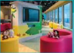
Little Pandas Club Kids club with supervised activities