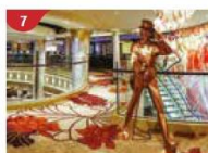
Johnnie Walker House™ Immerse yourself in the intricate world of premium Scotch whisky.