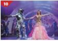
Zodiac Theatre Enjoy live production shows from the acclaimed award-winning entertainment team.