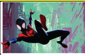
Party Time with Spider- Man: Into the Spider- Verse ปาร์ตี้และร่วมสนุกกับเหล่า ซูเปอร์ฮีโร่ ของท่าน