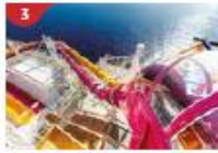
Waterslide Park Get drenched in fun on one of our six different waterslides.