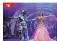
Zodiac Theatre Enjoy live production shows from the acclaimed award-winning entertainment team.