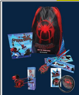
Spider-Man Scavenger Hunt ของรางวัลและของที่ระลึก