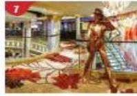
Johnnie Walker House™ Immerse yourself in the intricate world of premium Scotch whisky.