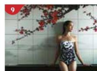
Crystal Life™ Spa Rejuvenate mind, body and soul with our holistic Western and Asian spa experience.