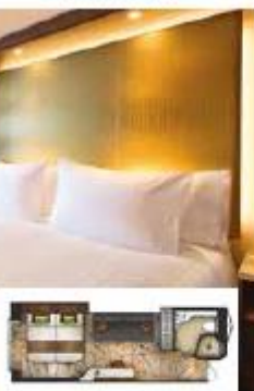
From 20 sq.m Max Occupancy 3-4 Deck 8/9/10/11/12/13/15 1 Queen-size Bed - 1 Single Sofa Bed/ 1 Single Sofa Bed - 1 Ceiling Pullman Bed