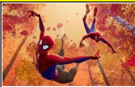
Meet & Greet with the Spider-Verse Heroes! ร่วมถ่ายรูปกับเหล่าซูเปอร์ฮี โร่