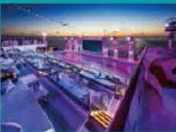
Zouk Beach Club Outdoor party/entertainment venue.