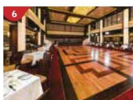
Dream Dining Room Savour a wide variety of Asian and international cuisine.