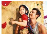
Rock Climbing Wall Challenge yourself on our mountainous rock climbing wall.