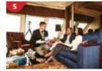
The Palace Indulge in European-style butler service and exclusive facilities.