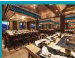
Umi Uma Teppanyaki Grand tables for grilling action