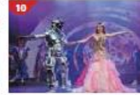
Zodiac Theatre Enjoy live production shows from the acclaimed award-winning entertainment team.