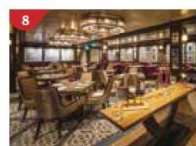
Bistro By Mark Best Relish contemporary Western cuisine from the internationally-acclaimed Australian chef.