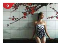
Crystal Life™ Spa Rejuvenate mind, body and soul with our holistic Western and Asian spa experience.