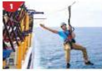
Ropes Course & Zipline Feel the thrill of gliding above the ocean on a 35-metre zipline.