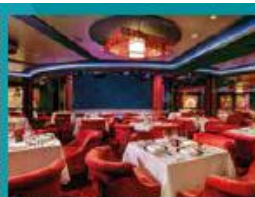
Silk Road Chinese Restaurant Chinese fine dining in old glamour setting