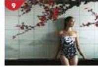
Crystal Life™ Spa Rejuvenate mind, body and soul with our holistic Western and Asian spa experience.