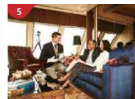
The Palace Indulge in European-style butler service and exclusive facilities.