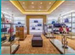
The Dream Boutiques Spurge on duty-free shopping