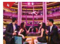
Bar 360 Catch live music and aerial acrobatic performances with a glass of champagne.