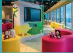
Little Pandas Club Kids club with supervised activities