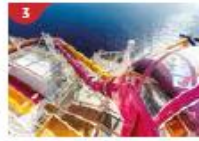
Waterslide Park Get drenched in fun on one of our six different waterslides.