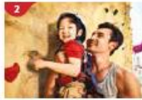
Rock Climbing Wall Challenge yourself on our mountainous rock climbing wall.