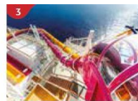
Waterslide Park Get drenched in fun on one of our six different waterslides.