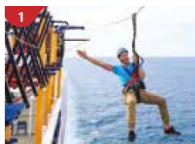
Ropes Course & Zipline Feel the thrill of gliding above the ocean on a 35-metre zipline.