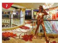
Johnnie Walker House™ Immerse yourself in the intricate world of premium Scotch whisky.