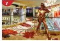
Johnnie Walker House™ Immerse yourself in the intricate world of premium Scotch whisky.