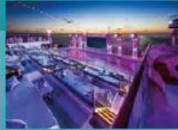
Zouk Beach Club Outdoor party/entertainment venue