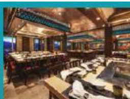
Umi Uma Teppanyaki Grand tables for grilling action