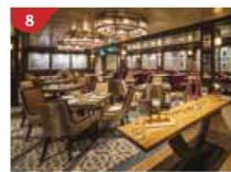
Bistro By Mark Best Relish contemporary Western cuisine from the internationally-acclaimed Australian chef.