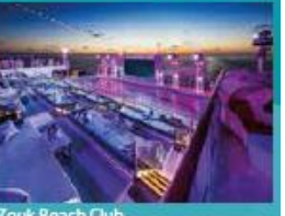
Zouk Beach Club Outdoor party/entertainment venue.