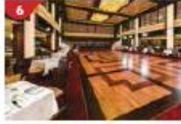
6 Dream Dining Room Savour a wide variety of Asian and international cuisine.