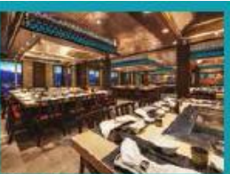
Umi Uma Teppanyaki Grand tables for grilling action.