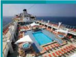
Main Pool Deck Stay cool at the swimming pool.