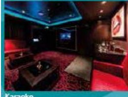
Karaoke Five private karaoke rooms.