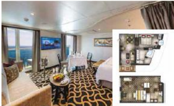
PALACE DELUXE SUITE

From 41 sq.m | Max Occupancy 4 | Deck 9/10/11/12/13/15 1 Queen-size Bed - 1 Double Sofa Bed