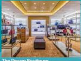
The Dream Boutiques Splurge on duty-free shopping.