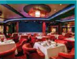
Silk Road Chinese Restaurant Chinese fine dining in old glamour setting.