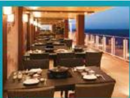
Hot Pot Outdoor hot pot with scenic ocean views.