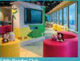
Little Pandas Club Kids club with supervised activities.