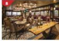
8 Bistro by Mark Best Relish contemporary Western cuisine from the internationally-acclaimed Australian chef.