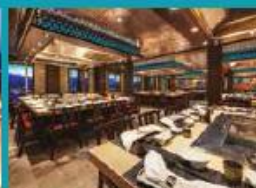
Umi Uma Teppanyaki Grand tables for grilling action.