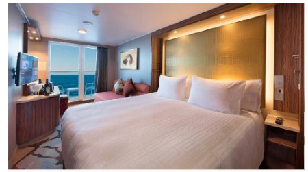
ห้องมีระเบียง Balcony