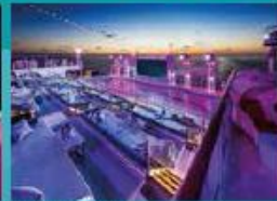
Zouk Beach Club Outdoor party/entertainment venue.