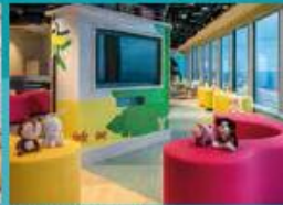
Little Pandas Club Kids club with supervised activities.