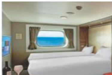
ห้องพักมีหน้าต่าง Ocean View