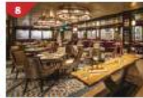
Bistro by Mark Best Relish contemporary Western cuisine from the internationally-acclaimed Australian chef.