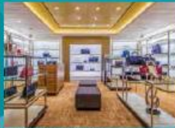
The Dream Boutiques Splurge on duty-free shopping.