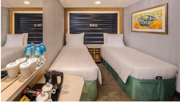
ห้องพักแบบไม่มีหน้าต่าง