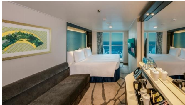
ห้องพักแบบมีระเบียง