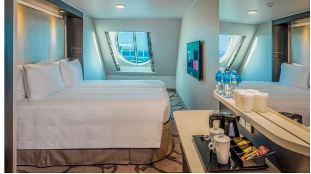
ห้องพักแบบมีหน้าต่าง