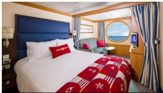
Deluxe Oceanview Stateroom