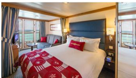
Deluxe Oceanview Stateroom with Verandah