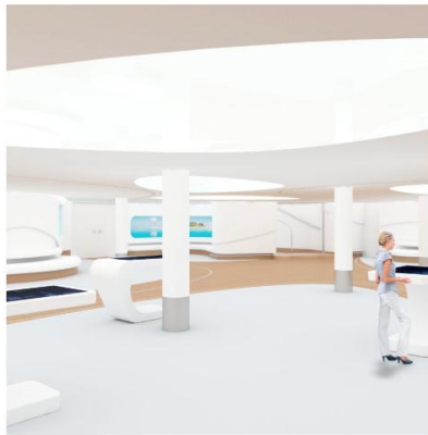
The Destination Gateway