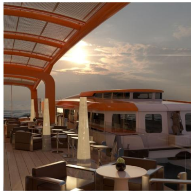
Edge Launches SM