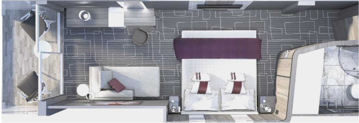
Deluxe Ocean View Stateroom with Veranda 202 sq. ft. / Veranda 40 sq. ft.