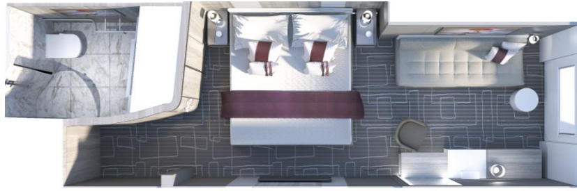
Ocean View Stateroom 200 sq. ft.