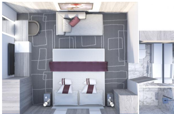
Inside Stateroom 181 sq. ft.