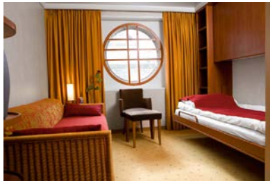
ห้องพักแบบ Outside โซน S ชั้น 1

จองตั๋วเครื่องบิน รับประกันราคาถูก คลิก etravelway.com/airticket