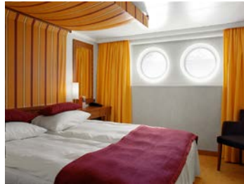
ห้องพักแบบ Outside โซน A ชั้น 1