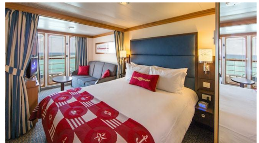
Standard Inside Stateroom (169 sq. ft.) Deluxe Oceanview Stateroom with Verandah (246 sq.ft. )