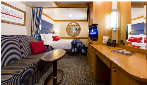
Standard Inside Stateroom