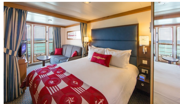
Deluxe Oceanview Stateroom with Verandah