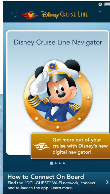
แอป Disney Cruise Line Navigator

รีวิว Disney dream https://www.thanop.com/disney-cruise-dream-review/4/