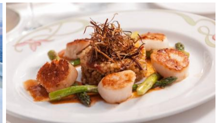
ห้องอาหารสุดพิเศษ