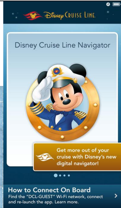
แอป Disney Cruise Line Navigator

https://www.thanop.com/disney-cruise-dream-review/4/