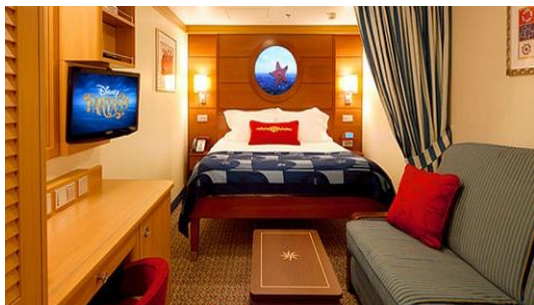
Standard Inside Stateroom

จองตั๋วเครื่องบิน รับประกันราคาถูก คลิก etravelway.com/airticket