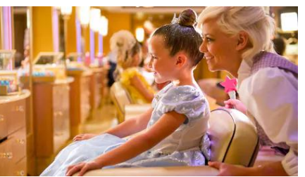
กิจกรรมผ่อนคลาย