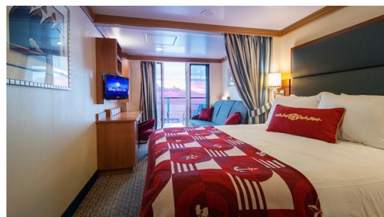
Deluxe Oceanview Stateroom with Verandah