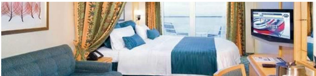
ห้องพักแบบ Inside

ห้องพักมีระเบียงวิวทะเล (Ocean View with Balcony)