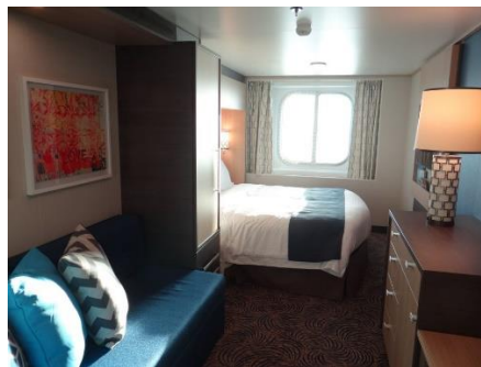
Ocean view stateroom