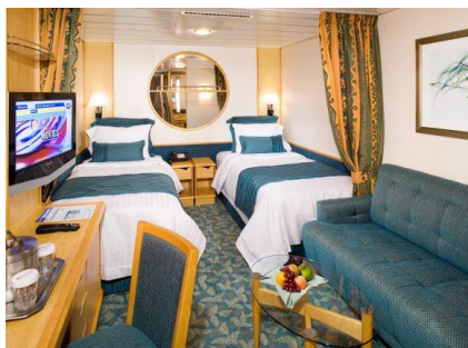
ห้องไม่มีหน้าต่าง