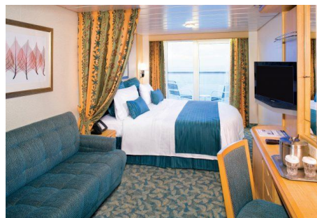
ห้องมีระเบียง