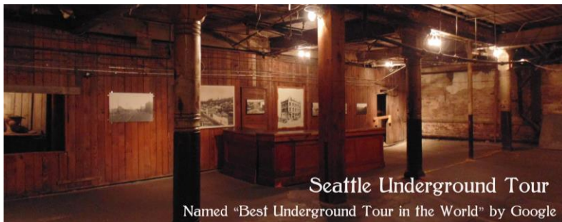
Seattle Underground Tour Named "Best Underground Tour in the World" by Google