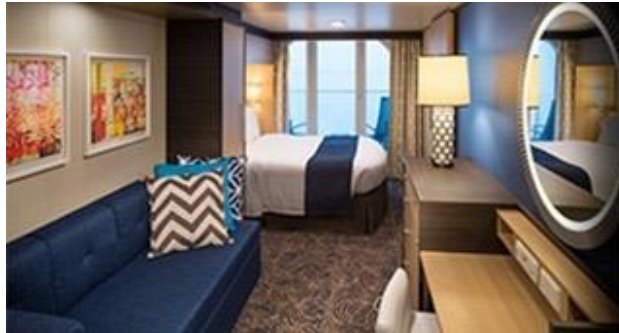
ขนาดห้องพัก : 198 ตารางฟุต ขนาดระเบียง: 55 ตารางฟุต