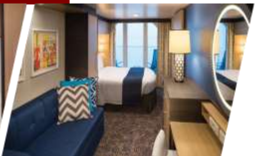
ห้องแบบมีระเบียง