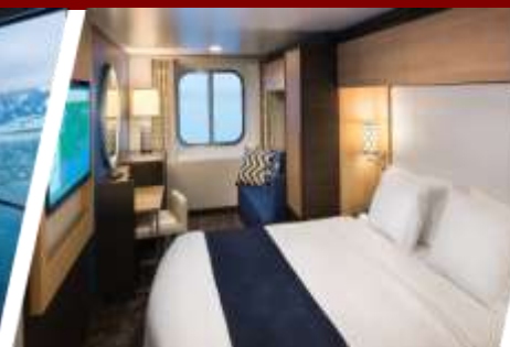
ห้องแบบมีหน้าต่าง