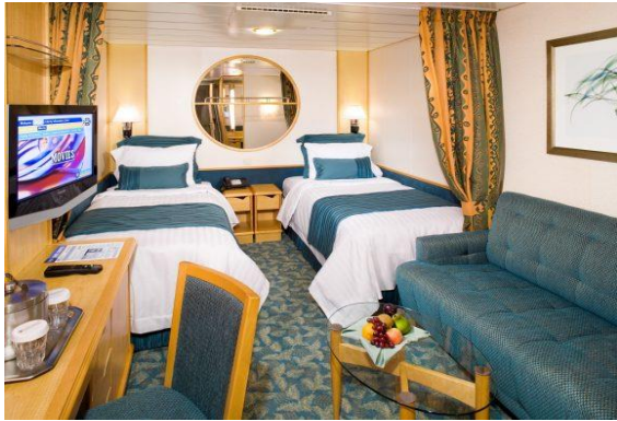
ห้องไม่มีหน้าต่าง Interior Stateroom