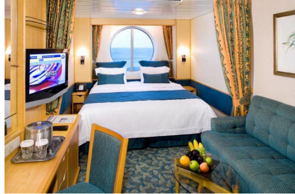
ห้องมีหน้าต่าง Ocean View Stateroom