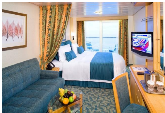
ห้องมีระเบียง Balcony Stateroom