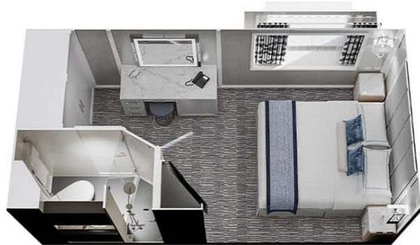
ห้องพัก แบบมีหน้าต่างต่าง C2 - Deluxe Ocean View Deck 4 Size 165 / 15 SQ FT / SQ M