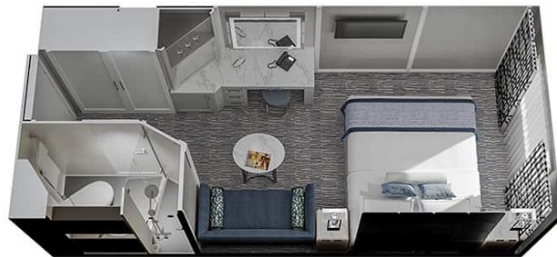
ห้องพักมีระเบียง B2 - Veranda Stateroom Deck 6 Size 1216 / 20 SQ FT / SQ M