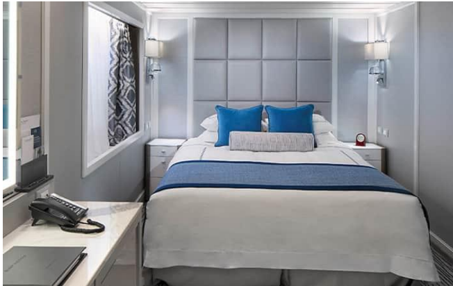
ห้องพักแบบหน้าต่างต่าง E - Ocean View Deck 6 Size 143 / 13 SQ FT / SQ M