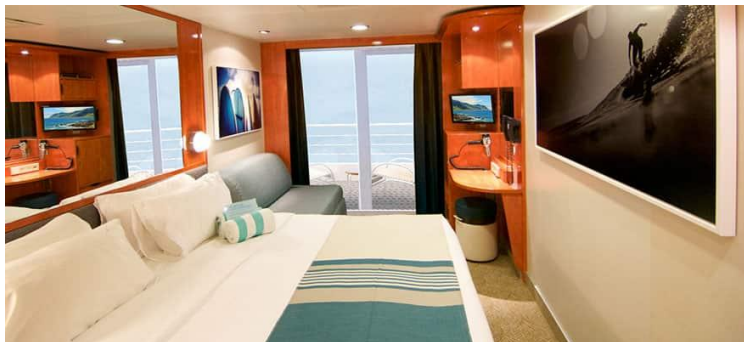
Size: 178 sq. ft. DECKS 10,11,9,8,7