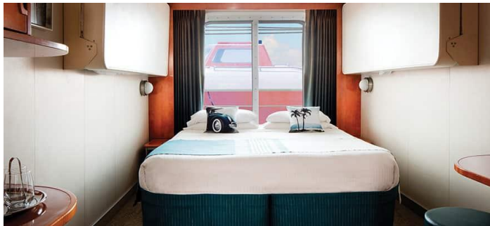
Size: 144 sq. ft. DECKS 4,7