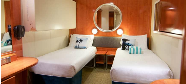
Size: 132-134 sq. ft. DECKS 4,7,8,9,10,11,13