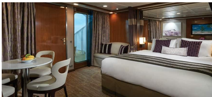
Penthouse with Large Balcony / DECKS 8,9,10 / LOCATION AFT / Size: 341-387 sq. ft.