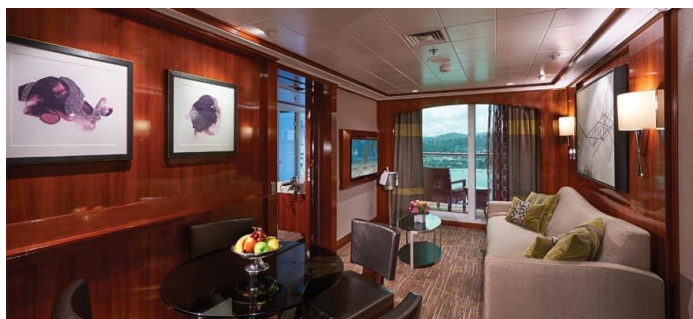
The Haven Courtyard Penthouse with Balcony / DECKS 14 / LOCATION MID / Size: 440 sq. ft.