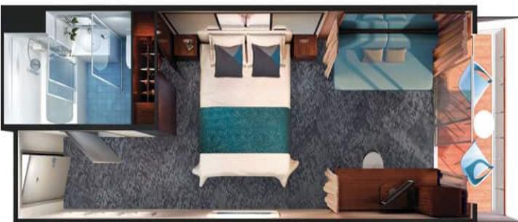
Mini-Suite with Balcony / DECKS 11 / LOCATION FORWARD, AFT