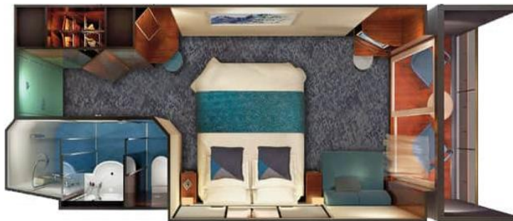
Balcony / DECKS 10,9,8 / LOCATION FORWARD, AFT FORWARD / Size: 272 – 285 sq. ft.