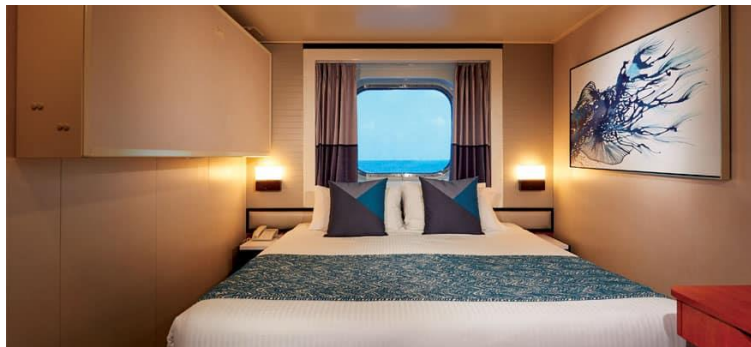
Sail Away Oceanview / DECKS 4,5,8 / LOCATION FORWARD, MID, AFT / Size: 155 sq. ft.