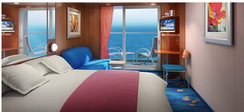
Balcony / DECKS 10,9,8 / LOCATION FORWARD, AFT FORWARD / Size: 205 sq. ft.