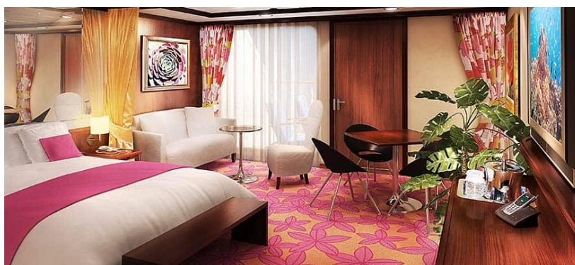
Penthouse with Large Balcony / DECKS 9,10,8 / LOCATION FORWARD AFT / Size: 341-578 sq. ft.