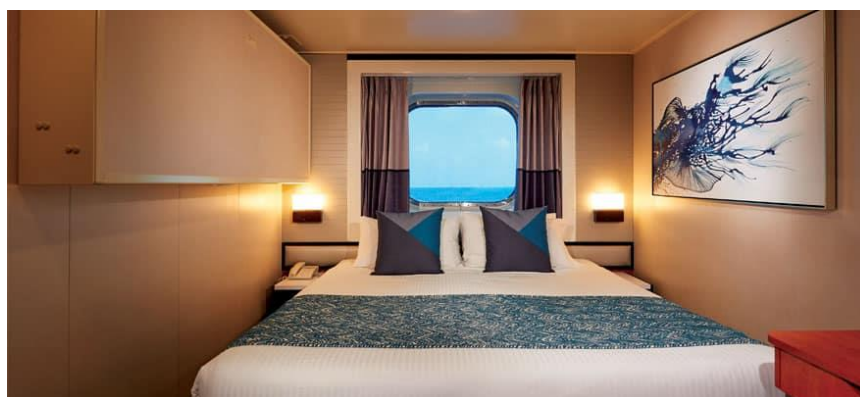
Sail Away Oceanview / DECKS 4,5,8 / LOCATION FORWARD, MID, AFT / Size: 155 sq. ft.