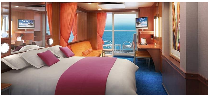
Mini-Suite with Balcony / DECKS 11 / LOCATION FORWARD, AFT / Size: 272 sq. ft.