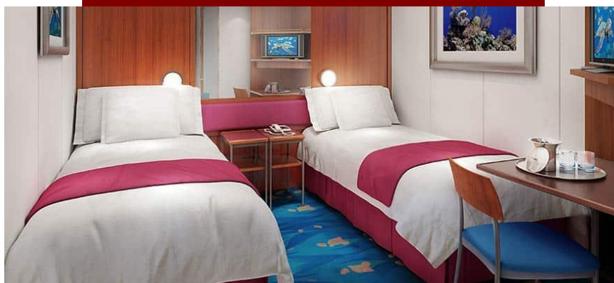
Inside / DECKS 10,11,8,9,4,5 / LOCATION FORWARD, MID, AFT FORWARD, MID / Size: 138-278 sq. ft.