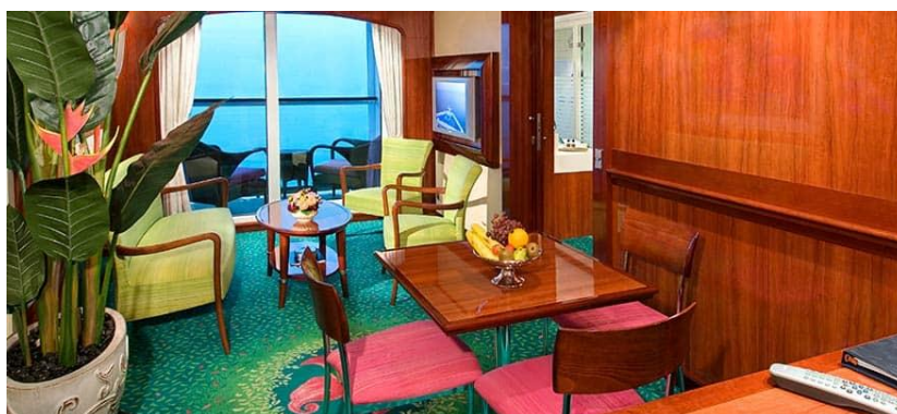
The Haven Courtyard Penthouse with Balcony / DECKS 14 / LOCATION MID / Size: 440 sq. ft.