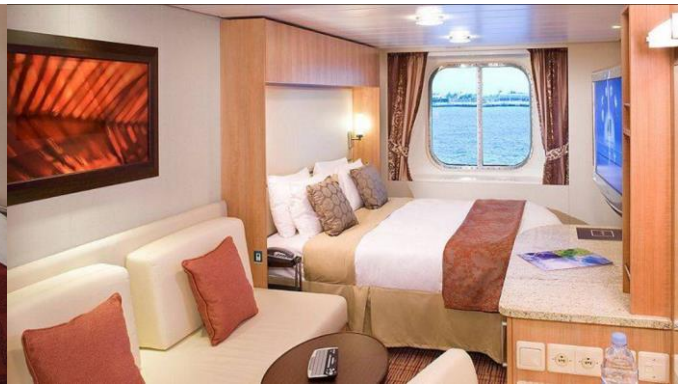
Ocean View Staterooms